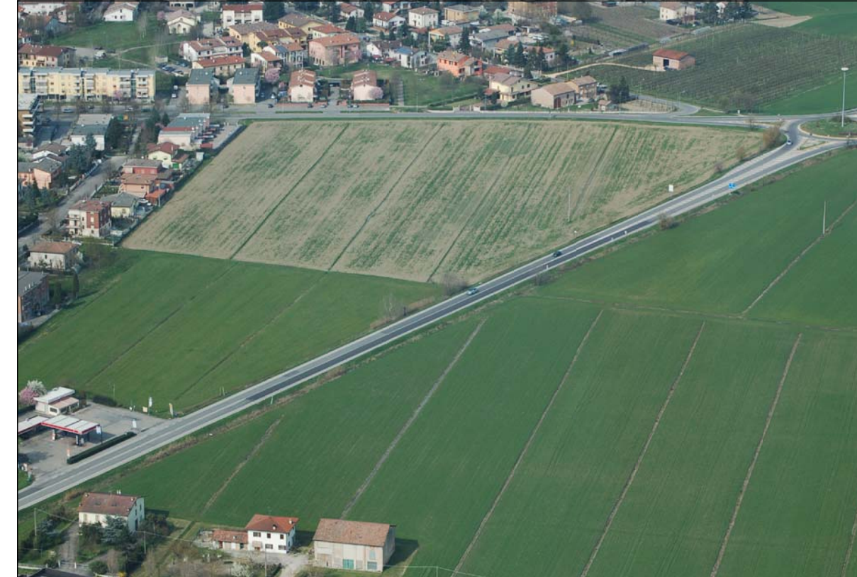
Punto di vista F