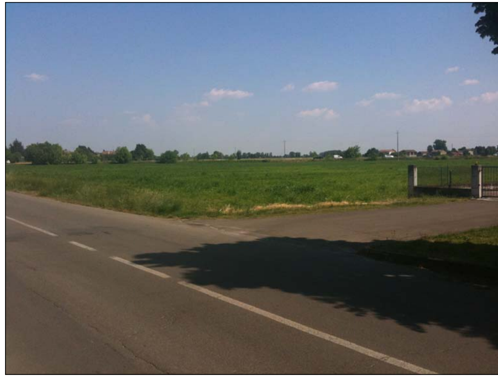
Punto di vista B