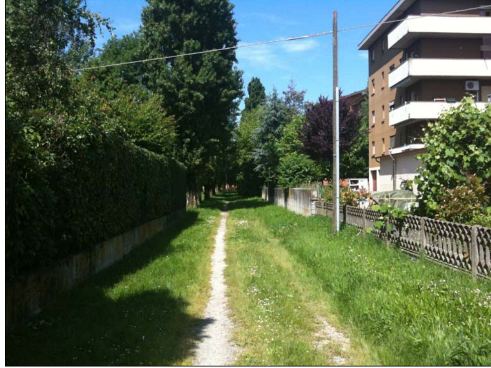
Punto di vista B